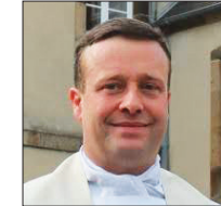
Coll. Bible et mystique, n°25