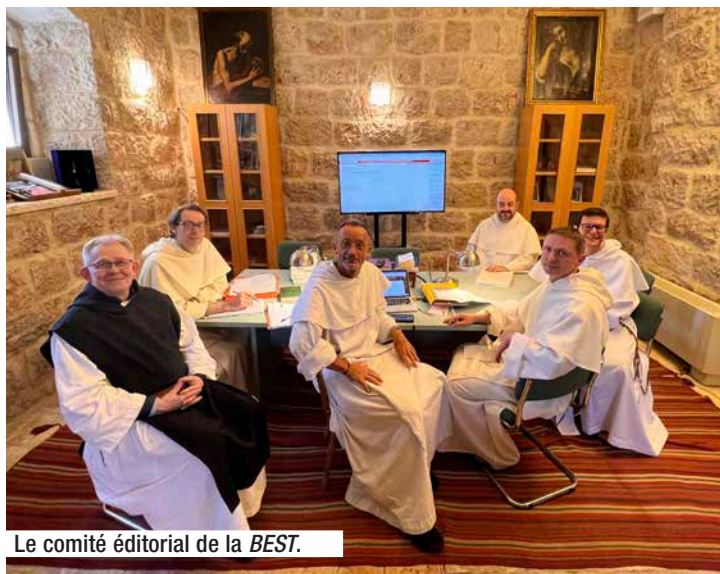
Le comité éditorial de la BEST.